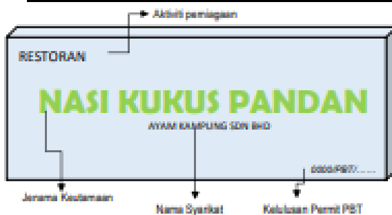
Rajah 3: Contoh kandungan dan visual paparan papan tanda.