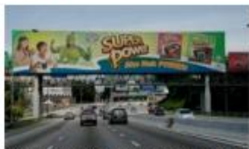
Papan iklan ini tidak mengabaikan penggunaan Bahasa Melayu dengan tepat dan betul.