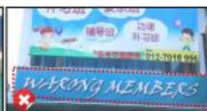
Foto 9: Contoh penggunaan bahasa di papan tanda tidak boleh dicampur aduk.