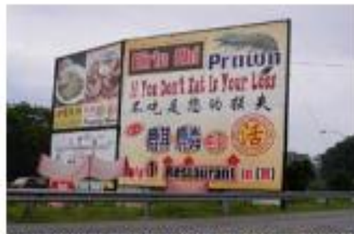
Tiada penggunaan Bahasa Melayu di dalam pengiklanan tidak dibenarkan.

Penggunaan bahasa yang betul hendaklah dirujuk dan mendapat pengesahan daripada Dewan Bahasa dan Pustaka;