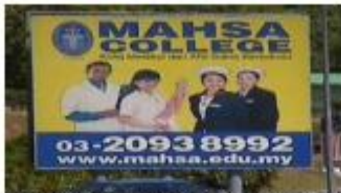
Papan iklan yang memaparkan wajah-wajah kepribadian kaum di Malaysia adalah diwajibkan.